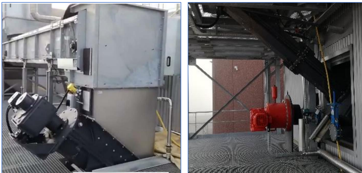
Figura 2 - VISTE FOTOGRAFICHE "ALIMENTAZIONE DIGESTORE TIPO"

Si può vedere, a titolo di esempio, la rappresentazione fotografica del sistema di alimentazione del digestore come di seguito riportata.