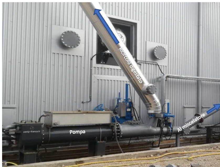
Figura 3 - VISTA FOTOGRAFICA DEL DISPOSITIVO DI "SCARICO TIPO" DEL BIODIGESTORE (POMPA)

Si può vedere, a titolo di esempio, la rappresentazione fotografica del sistema di scarico del digestore come di seguito riportata.