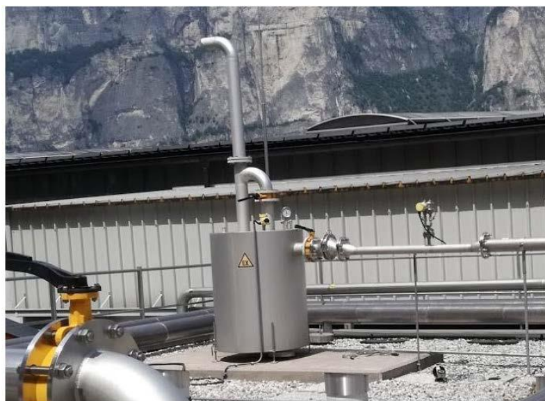
Figura 5 - VISTA FOTOGRAFICA DELLA "GUARDIA IDRAULICA TIPO"

L'UFFICIO TECNICO DEL CONSORZIO (Ing. Agostino Pruneddu)